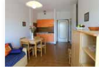
Prezzi settimanali / Wochenpreise / Weekly rent prices